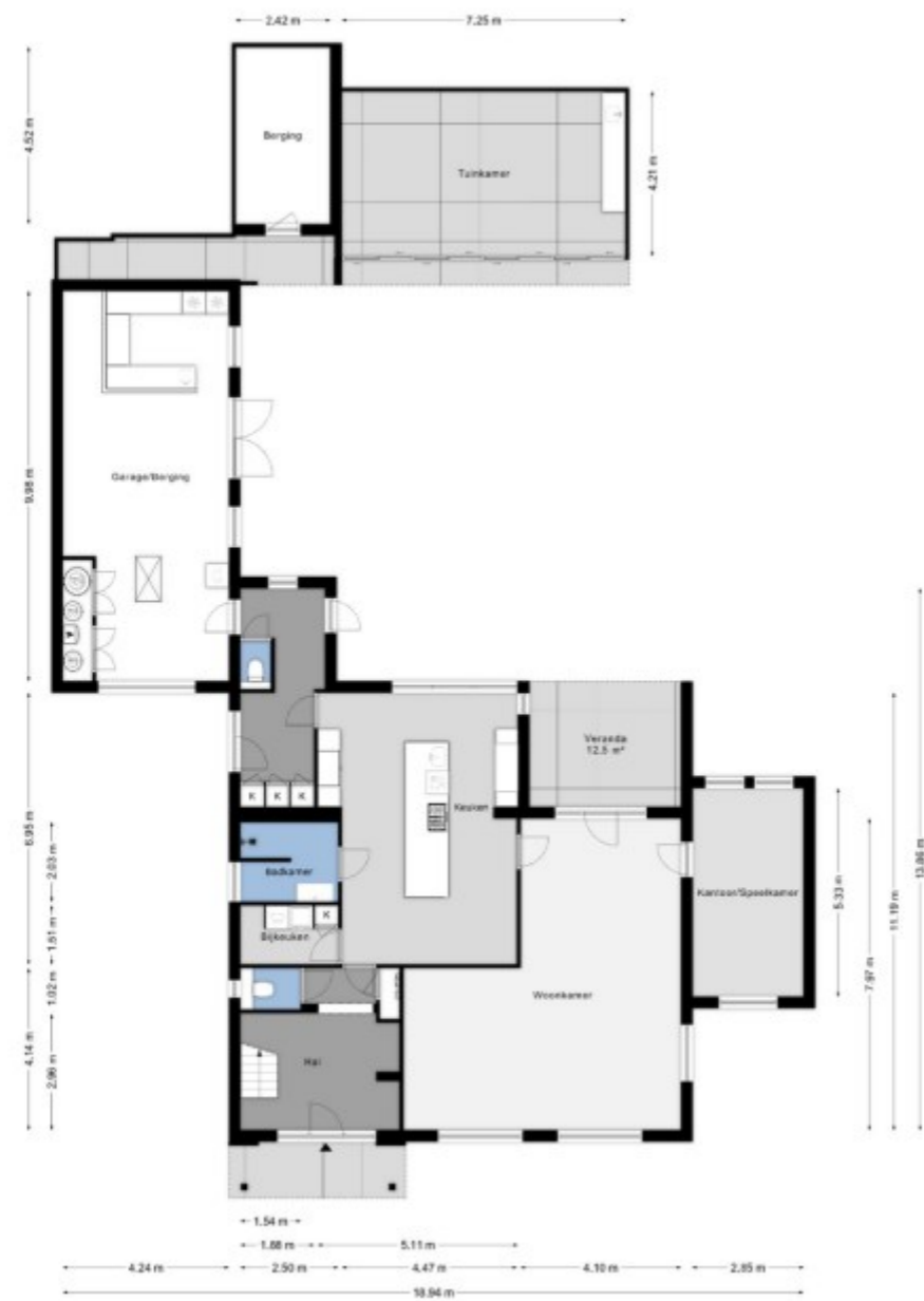
Plattegrond Begane grond