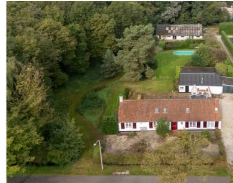
Breedschotsestraat 14 Rijsbergen