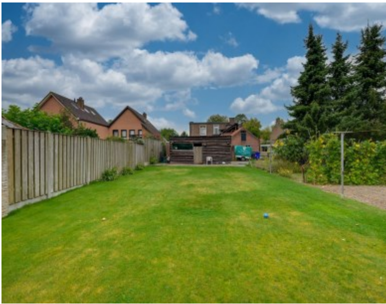
Bredaseweg 12 Rijsbergen