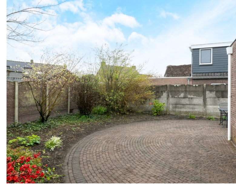
Dorpsstraat 33 Ulicoten