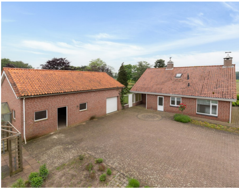
De Brand 34 Rucphen